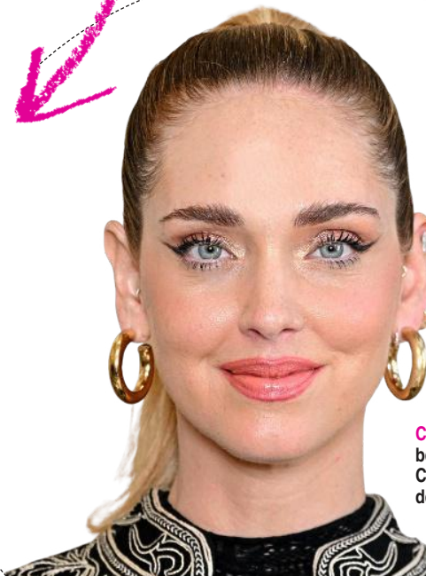
CHIARA FERRAGNI befolgt das Skin-Cycling und strahlt mit der Haut um die Wette